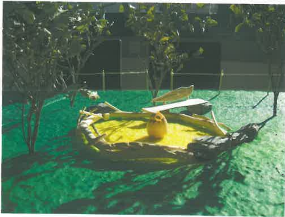
Abb. 1: Sandspiel-Vogelnest