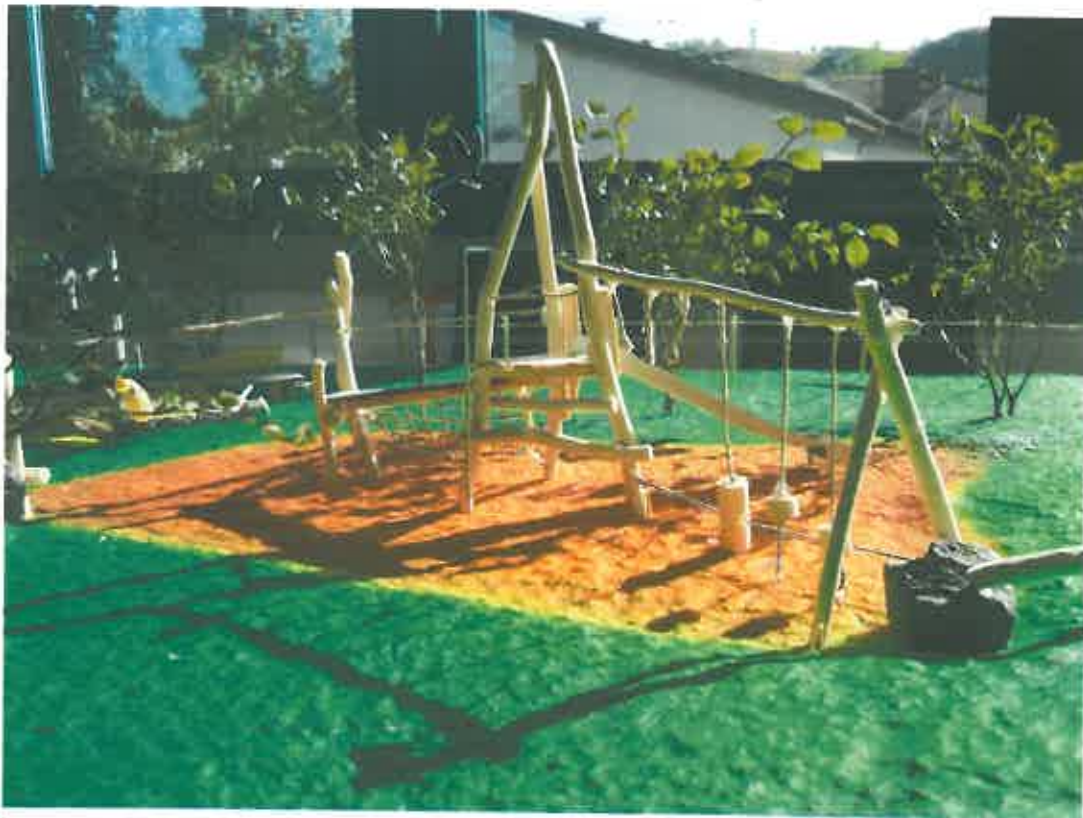
Abb. 3: Großspiel-Vogelwarte-Kletterei (von Nordosten)