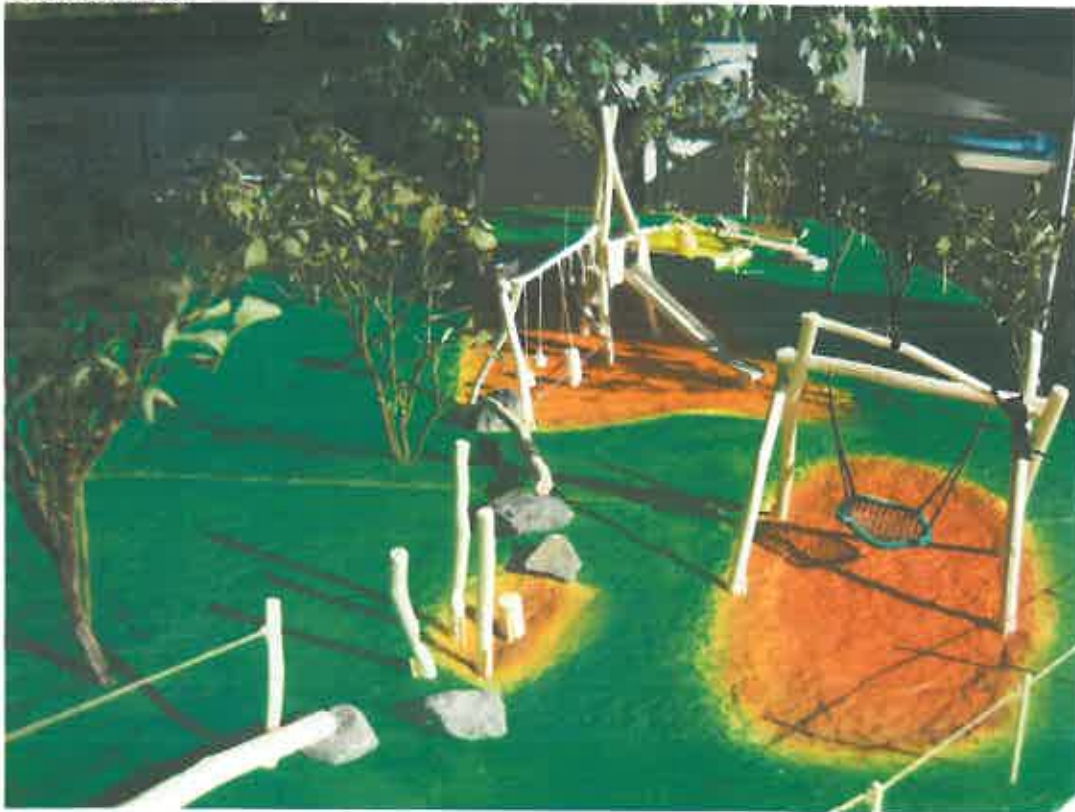
Abb. 6: Übersicht über den Platz (von Norden nach Süden)