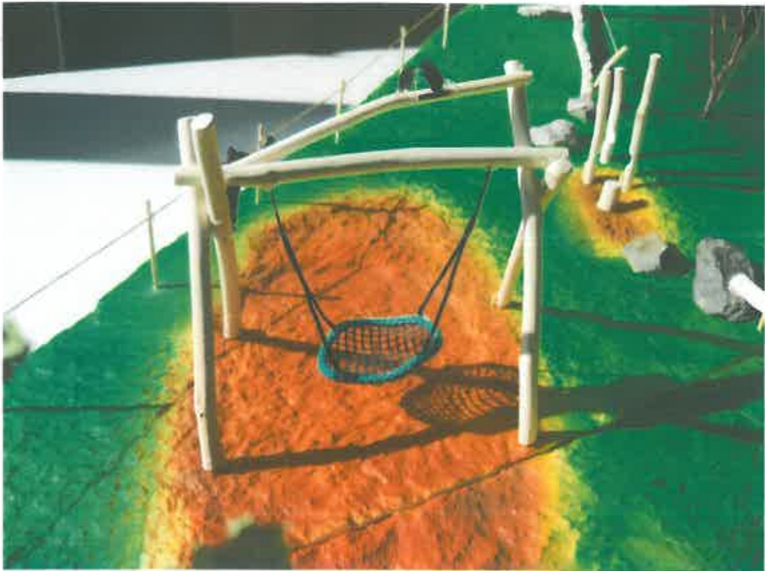
Abb. 5: Nestschaukel