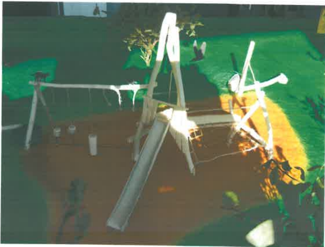
Abb. 2: Großspiel-Vogelwarte-Kletterei (von Westen)